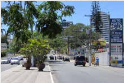
Garanhuns atrai turistas regionais durante o inverno.

Picos, PI: A 317 km da capital do estado Teresina, é conhecida por ser um polo comercial, além de um clima ameno. Com uma população acolhedora, essa cidade do interior do Piauí oferece uma infraestrutura adequada para os aposentados, com serviços de saúde e lazer adaptados às suas necessidades.