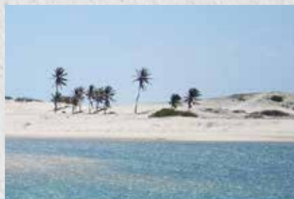
Cascavel tem diversas praias paradisíacas

Cascavel, CE: Distante pouco mais de 60 km de Fortaleza, a cidade é um destino encantador do litoral cearense com praias paradisíacas. A cidade destaca-se por ser um polo de turismo e comércio, além de oferecer fácil acesso a serviços especializados, como centros de saúde e atividades recreativas.