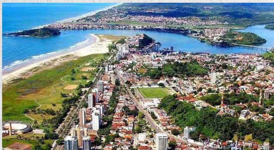
Ilhéus é a terra de Jorge Amado de Gabriela Cravo e Canela

Petrolina: A cidade, distante cerca de 636 km da capital Recife, é reconhecida nacionalmente como a segunda maior produtora de uvas do país. O município do sertão pernambucano já foi apontado como um dos melhores para morar, segundo pesquisa da Consultoria Delta Economics & Finance. Tem muito boa infra-estrutura, baixo nível de criminalidade, e o rio São Francisco com uma orla que oferece atrativos e muita diversão. Do outro lado do rio e na fronteira entre Pernambuco e Ceará está Juazeiro do Norte que está entre as melhores cidades brasileiras para viver e investir.