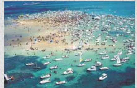
Cabedelo tem belas praias como Areia Vermelha

Currais Novos, RN: Distante cerca de 181 km de Natal, a cidade combina tranquilidade e desenvolvimento. Com uma infraestrutura moderna e serviços voltados para a terceira idade, a cidade oferece uma ótima qualidade de vida para os aposentados.