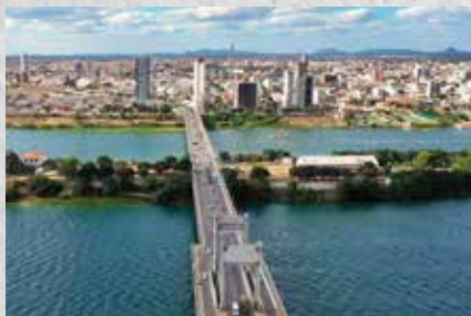
Apenas uma ponte separa Petrolina (PE) de Juazeiro (CE)