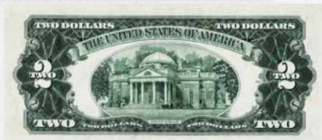
Nota de US$2 de 1953 em Frente e Verso

V ocê por acaso recebeu ou tem guardada alguma nota de US$ 2? Se sim, saiba que talvez seja melhor pensar duas vezes antes de gastá-la. Isso porque essas notas podem valer muito mais que os simples dois dólares. De acordo com o site U.S. Currency Auctions (USCA), por serem bastante antigas, algumas dessas notas podem chegar a US$ 4.500 ou mais no mercado de colecionáveis.