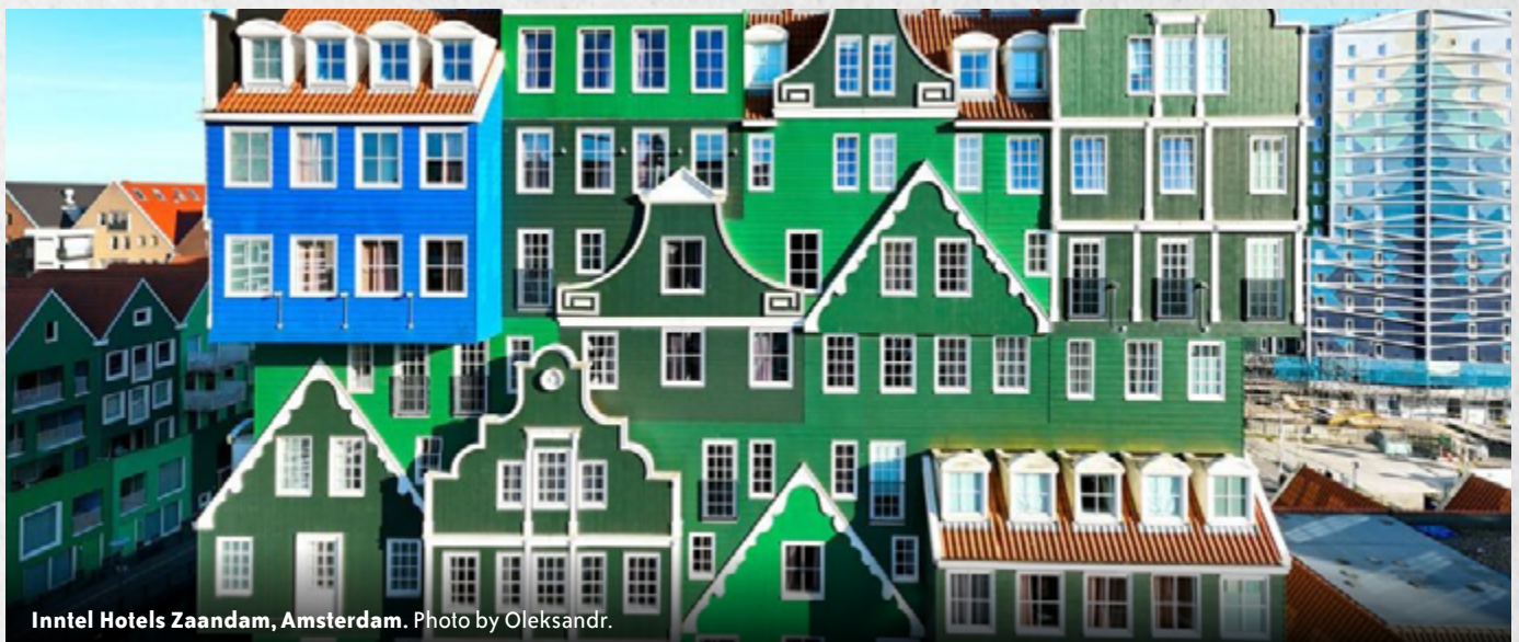
Intel Hotels Zaandam, Amsterdam.

former USSR member country gained independence from the Soviet Union in 1991, there was a concerted effort to leave behind the functionality of the Soviet era and embrace modern architecture. In a city where skyscrapers are increasingly the norm, the Heydar Aliyev Center's sleek appearance offers a refreshing change of pace. The use of fluid lines and folds in the building's fabric is designed to blur the boundary between the building itself and the spacious plaza that surrounds it. The result is an attractive city icon that invites passersby to sit and admire its beauty, or venture inside for regular events and exhibitions.