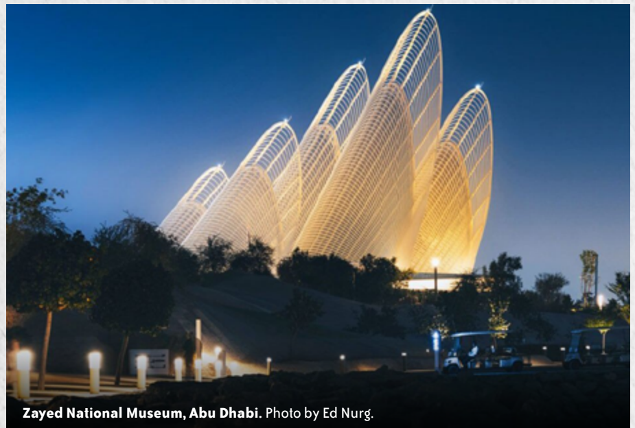
Zayed National Museum, Abu Dhabi.

a useful purpose. They are integral to the building's ventilation system, harnessing a similar technology that's been used by the Emirates' traditional barjeel wind towers for centuries. The low-slung structure on which they sit is a representation of the local desert topography - even its color is intentional, reflecting the hues of local sand - while the landscaped garden that surrounds the museum is another reminder of the relationship between people and their environment.