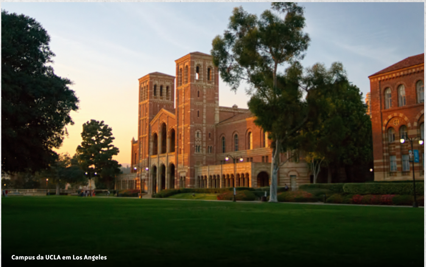
Campus da UCLA em Los Angeles

Especialistas concordam que o ensino superior nos EUA não está necessariamente em colapso, mas em transformação. Modelos híbridos, ensino online, microcredenciais e parcerias com empresas devem ganhar espaço nos próximos anos. A grande questão permanece: a universidade continuará sendo um caminho acessível para a maioria ou se tornará um privilégio de poucos?